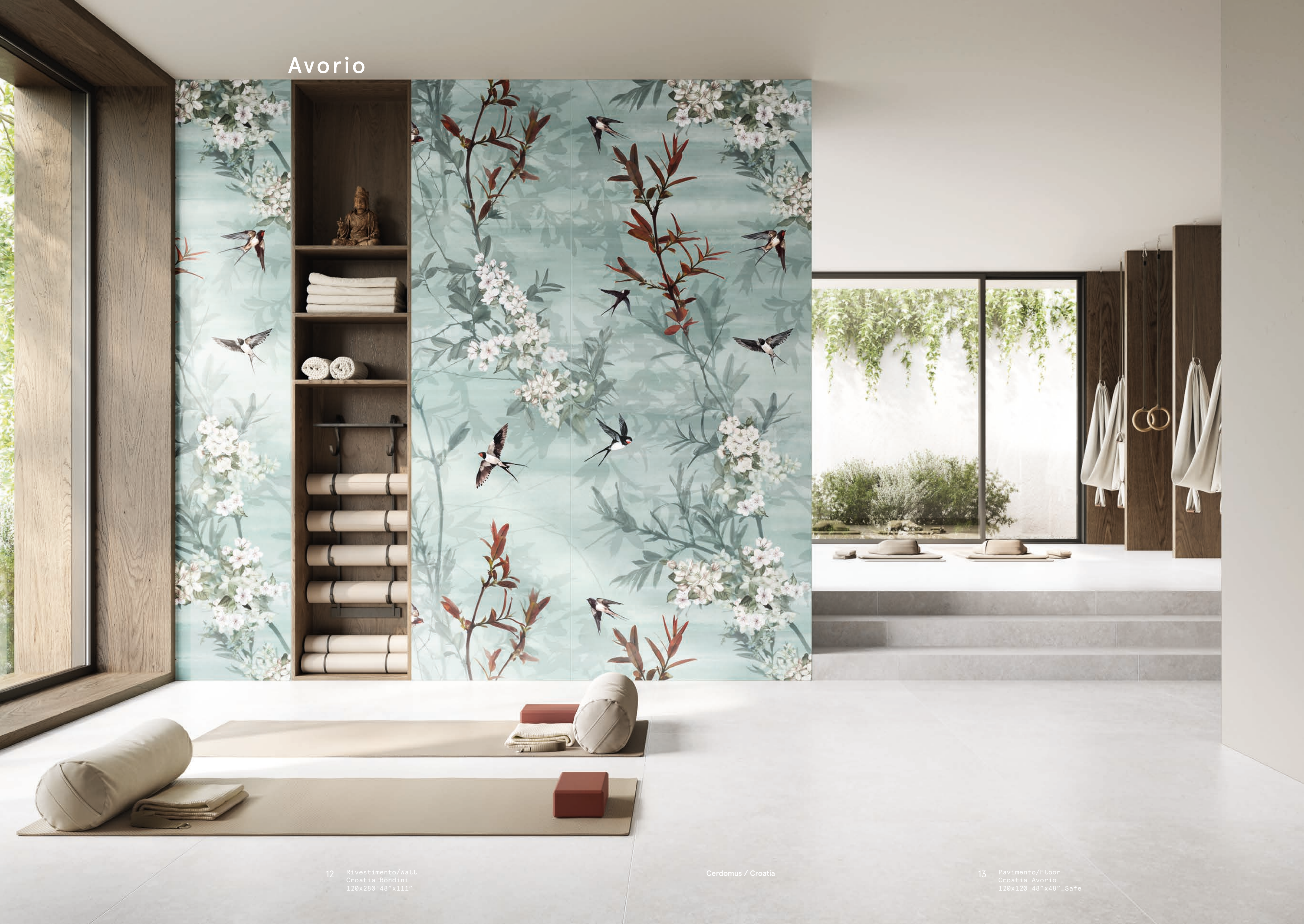
12 Rivestimento/Wall Croatia Rondini 120x280 48"x111"