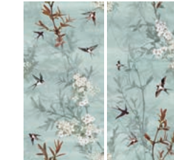
60x120 24"x48" (Set 2 pz)