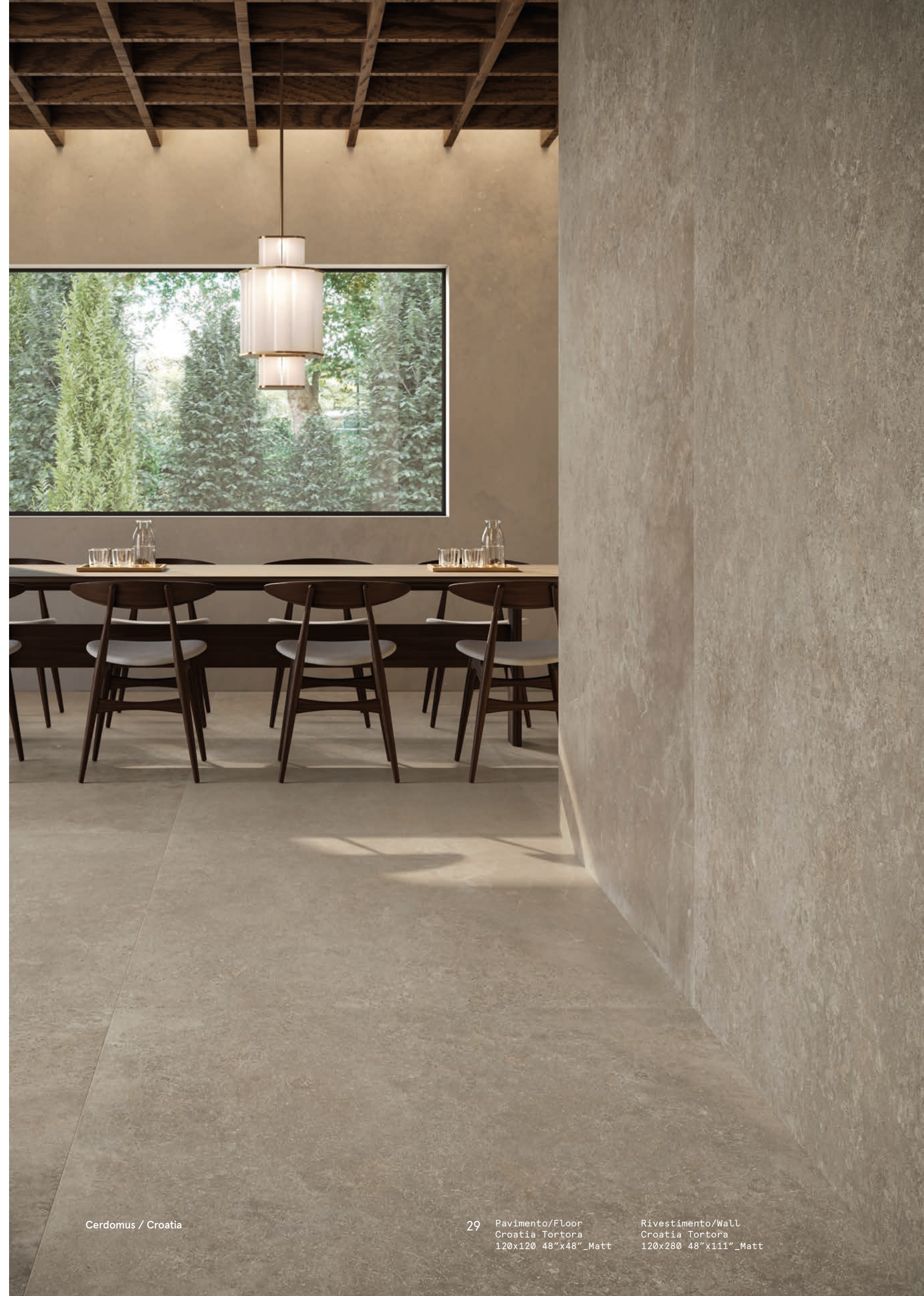
Cerdomus / Croatia