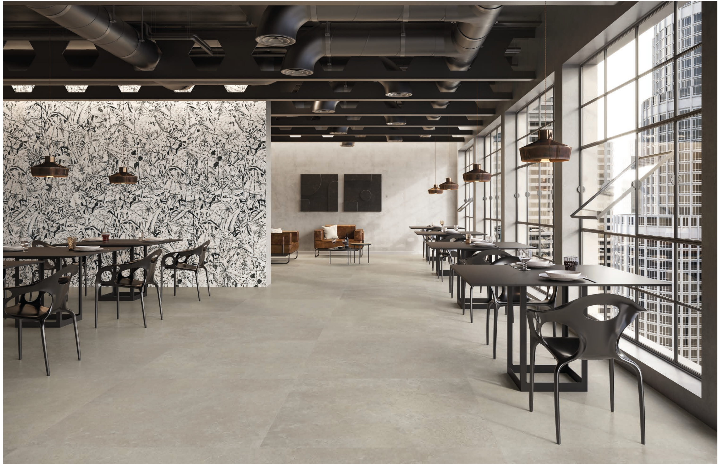
24 Rivestimento/Wall Croatia Tellas 120x280 48"x111"