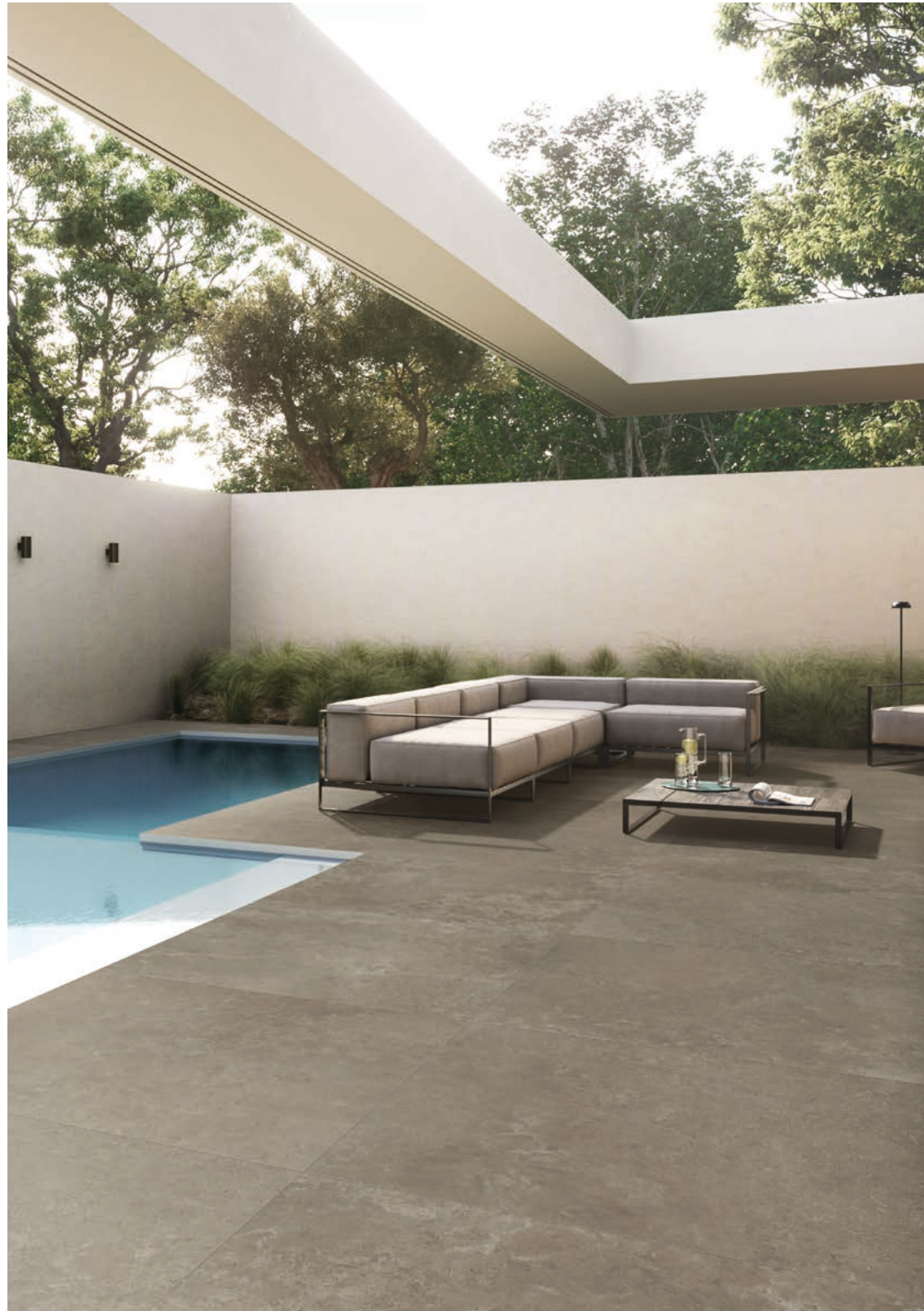
28 Pavimento/Floor Croatia Tortora 120x120 48"x48"_Safe