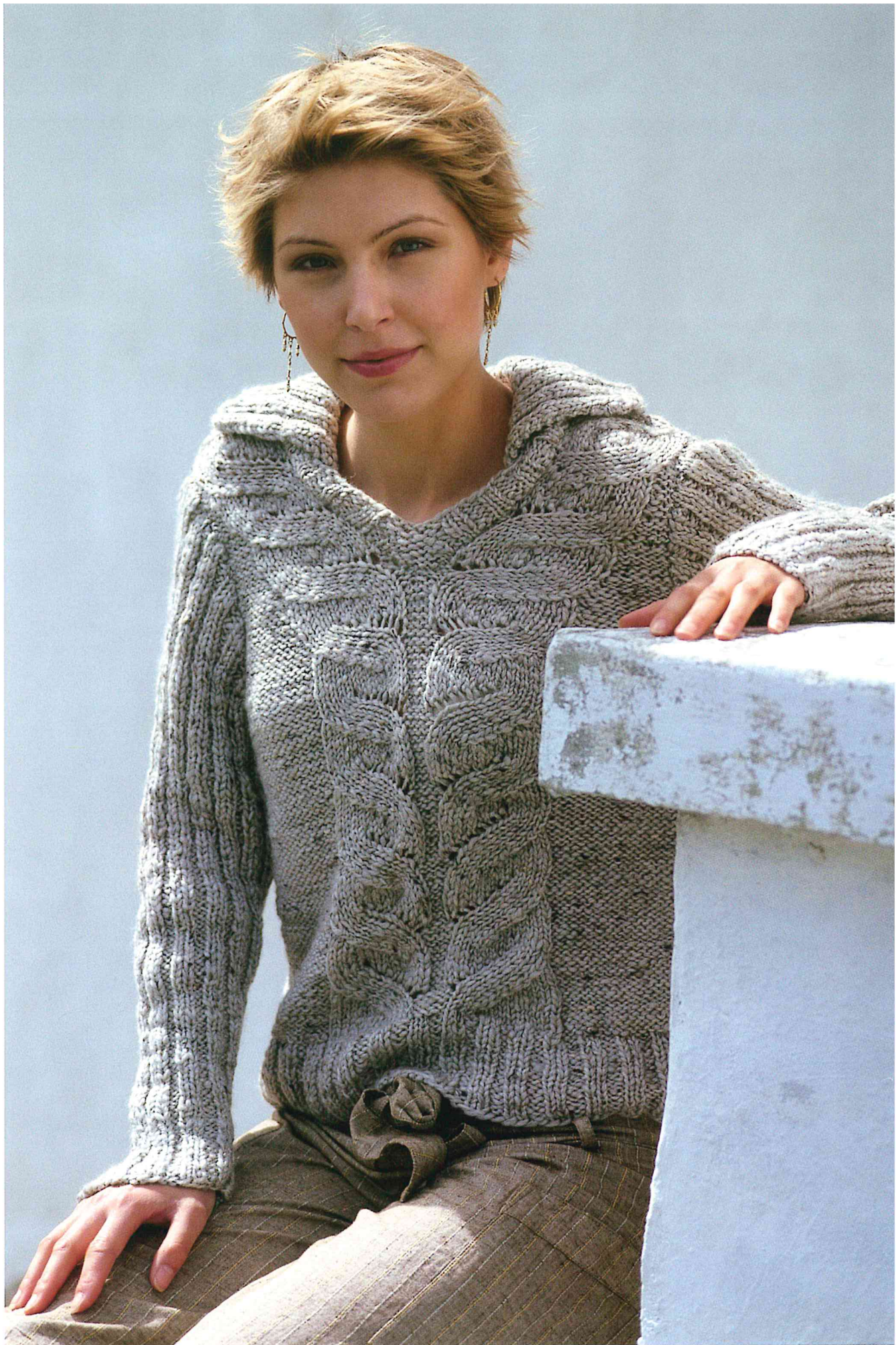
41966 / Need Soft Tweed / el.: Need Str. S - M - L - XL 11 - 12 - 13 - 14 ngl á 50 g