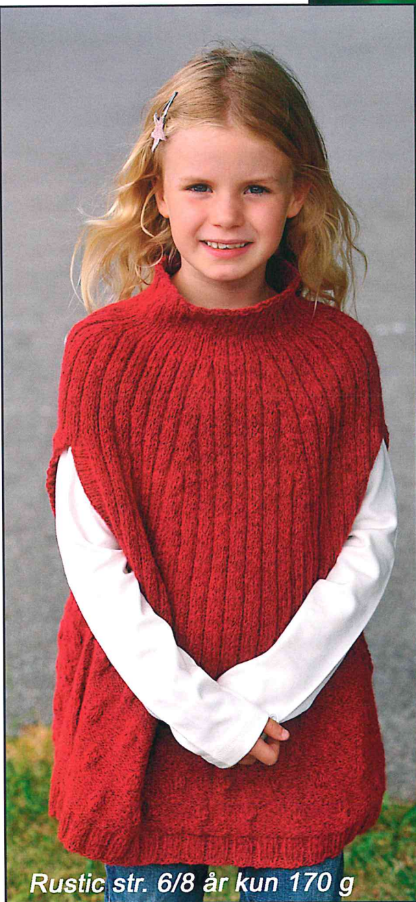
Rustic str. 6/8 år kun 170 g