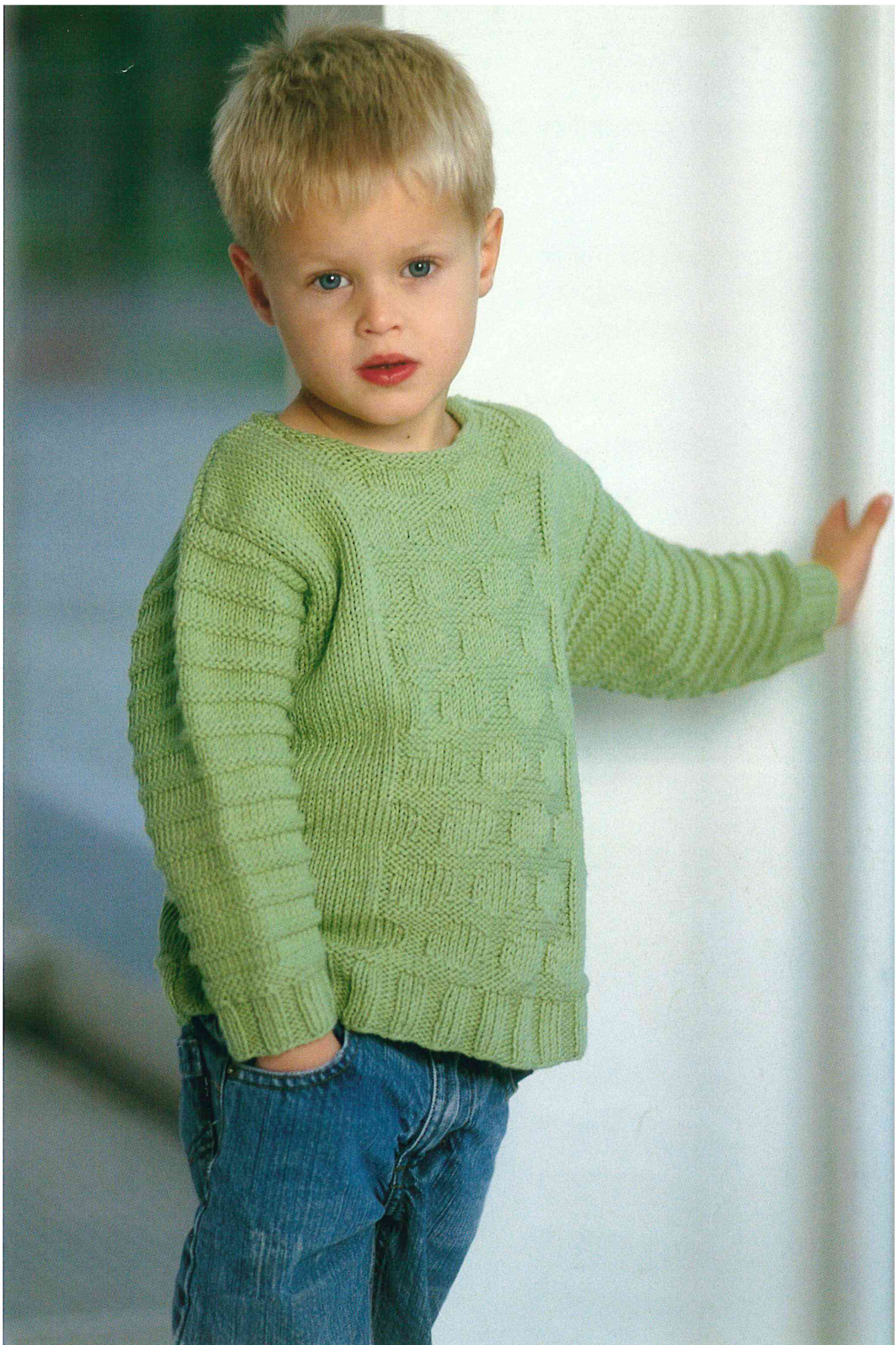
52827 / Linen / el.: Spray / Silky Str. 1 \frac{1}{2} - 3/4 - 5/6 - 7/8 år 5 - 6 - 7 - 8 ngl á 50 g