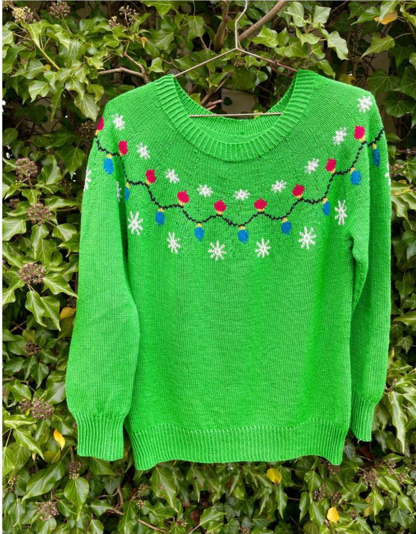
2595 / Ida / Design: Vian Hviid

GARN: lana bomull (50% ull, 50% bomull).