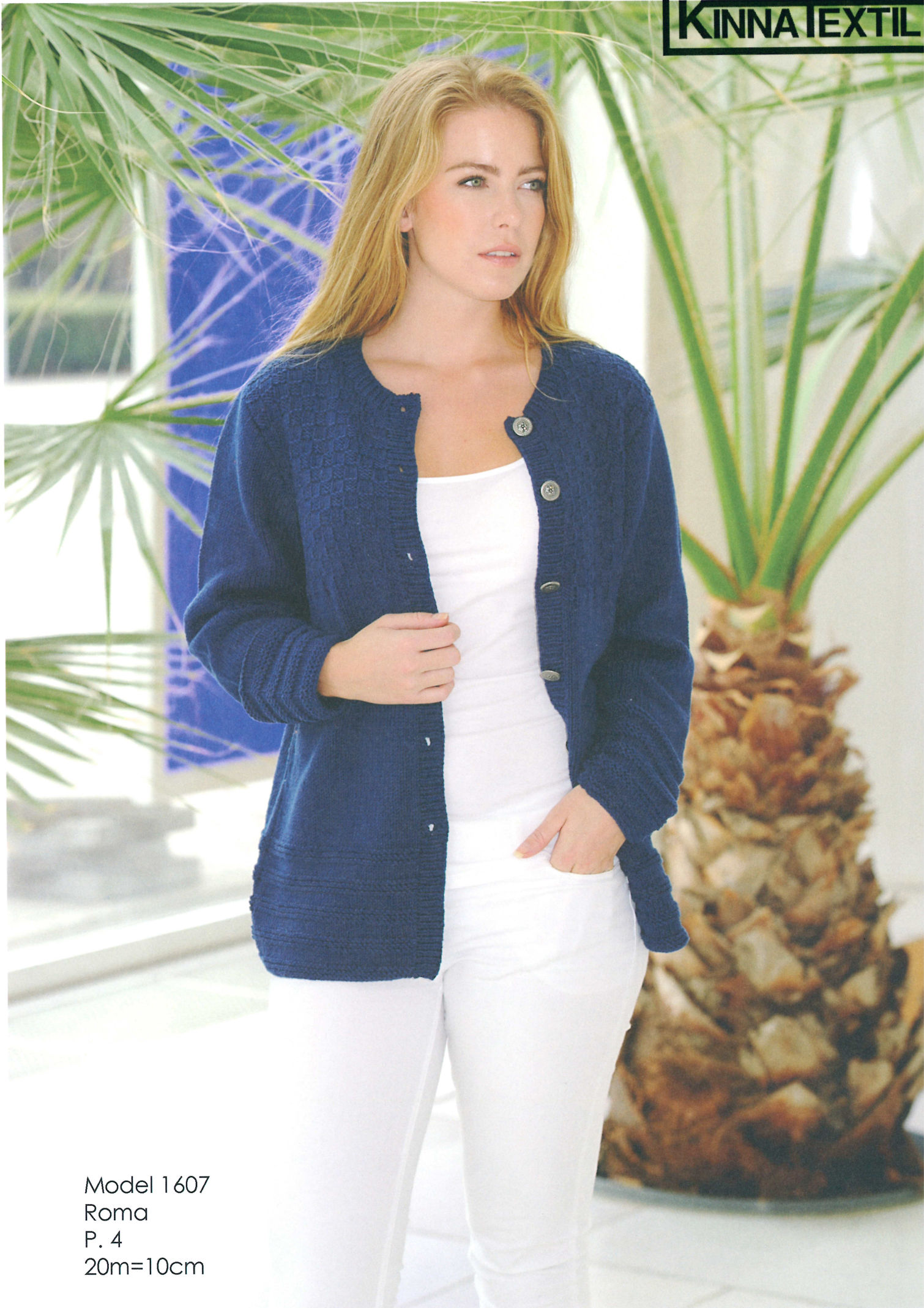
Model 1607 Roma P. 4 20m=10cm